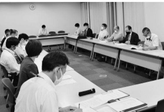
立川市との交渉の様子