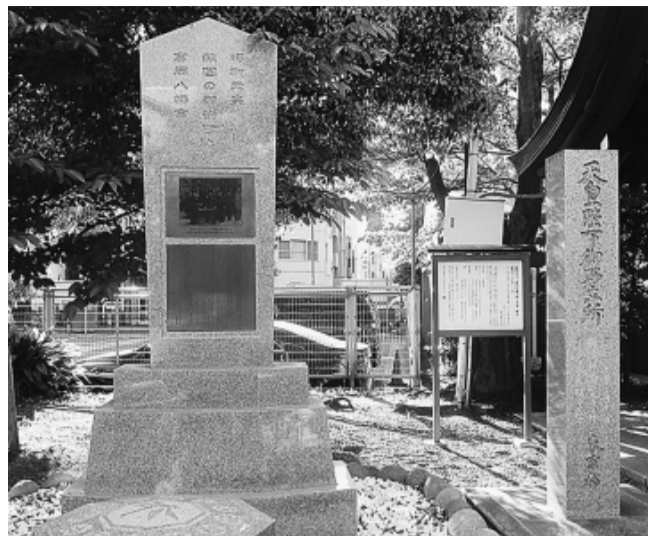
昨年、富岡八幡宮境内に建立された記念碑

【江東・設計・中尾正文記】江東区は、深川区と城東区が合併されて戦後発足。文化的には本所と一体でしたが、経済的な理由から農村部の城東区と一緒になりました。深川の地名は、江戸初期森下を拠点にしていた深川家に由来し