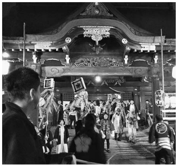
地元の人々が待ちわびるお会式