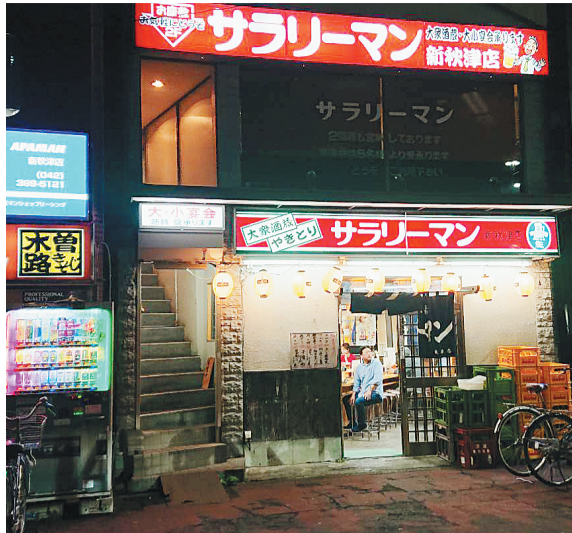
駅を降りた瞬間に目に入ってくる店構え

【小平東村山・土木基礎・屋サラリーマン】だ。1階はカウンターのみの約35席、外階段で入る2階はカウンターの4席とテーブル約40席という少し変わった造りの居酒屋だ。店内は昔ながらの