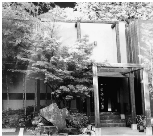
落ち着いた和の雰囲気の外観