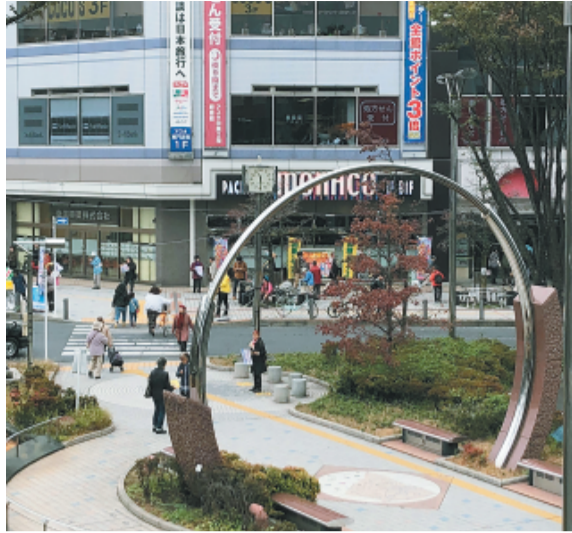
恒久平和の願いが込められた「平和のリング」