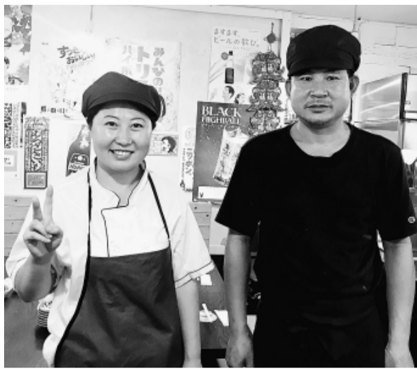
気さくな店長さん(左)が迎えてくれる