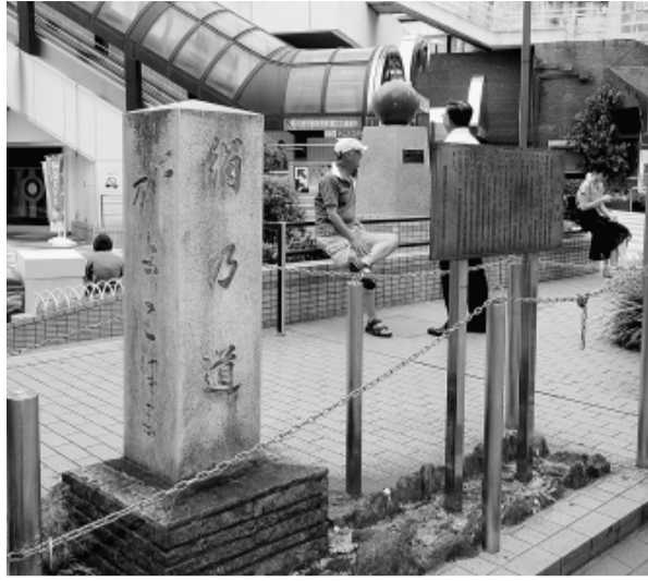
広場の一角に控えめにたたずむ石碑