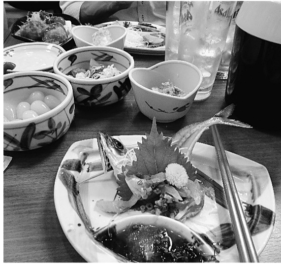
アジの刺身は中骨を揚げてもらえる