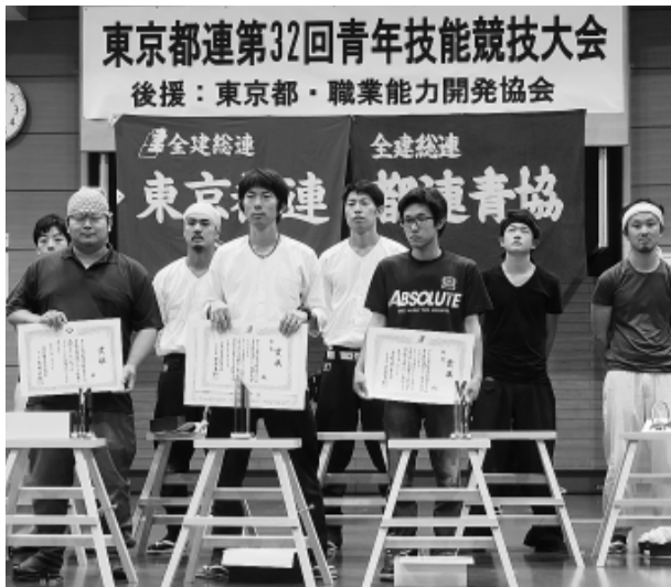
入賞は東京土建のカレッジ生(OB含む)が独占