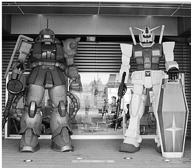
ド迫力のガンダム&シャア専用ザク