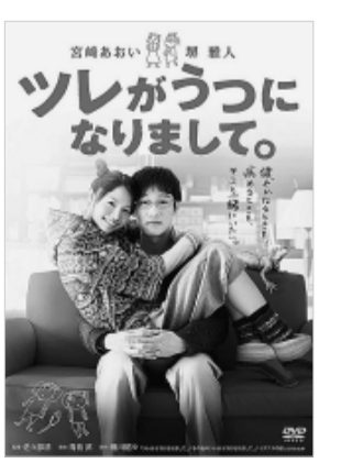
監督 佐々部 清

誤解が多く理解されにくい病だが、無理に克服しようとせず、自然に受け入れるハルさんとツレの頑張らない姿が微笑ましい。