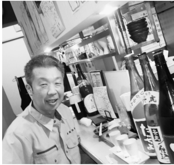
「見かけたら声をかけて」という筆者