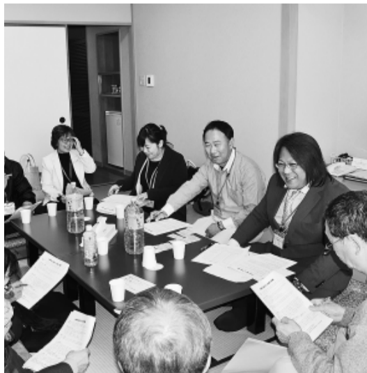
気軽な情報交換で笑顔の分散会