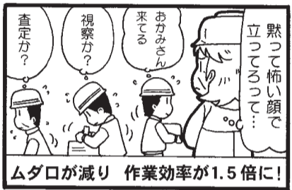
ムダロが減り 作業効率が1.5倍に!

も豊富で、おすすめは築地の仲卸から届く新鮮な魚と、テレビ番組『吉田類の酒場放浪記』でも紹介された、どじょう鍋・串焼き・揚げ物も人気です。