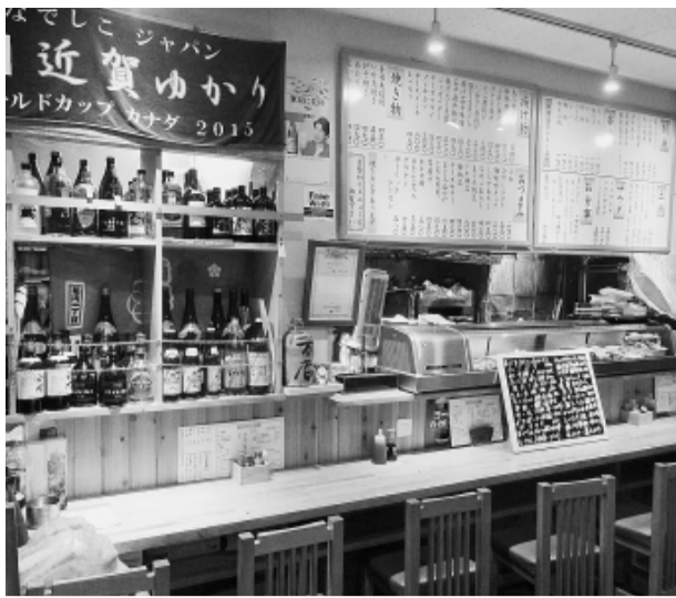
和風で落ち着いた雰囲気の内

【墨田・書記・長妻伸治通 信員】冬も近づき、お酒と鍋がおいしい季節になりました。そこで今回は、都営新宿線菊川駅から徒歩3分の所に