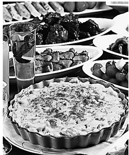
厳選された国産安全食材で作る本場イタリアン

【営業時間】17時〜23時 半※月末の金曜日はプレミアムフライデーのため15時から営業【住所】杉並区高円寺北2-3-3【電話】3330-3129【定休日】なし。※年末年始は営業時間変更の場合あり。