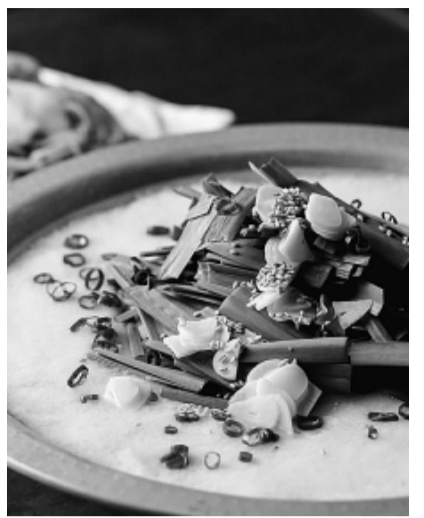
総料理長自慢の絶品もつ鍋

どけんファミリーカード提示で10%割引の大サービス。 【営業時間】11時半〜14時(月〜金)、17時〜24時(月〜土) ・祝・祝前 ※日は23時半まで、定休日なし※12月31日、1月3日は休み【住所】豊島区西池袋3-22-10ルミエール2F【電話】050-5890-5863